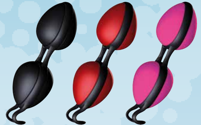
Schwarz-Schwarz Art.-Nr. 15001