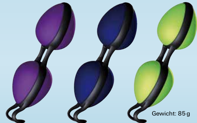
Violett-Schwarz Art.-Nr. 15004